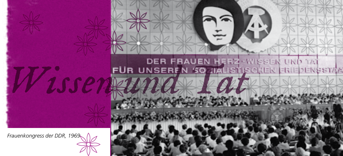
Frauenkongress der DDR, 1969

Auch nach 1950 laden Ministerpräsident Grotewohl und ab 1962 Walter Ulbricht in seiner Funktion als Staatsratsvorsitzender zum Internationalen Frauentag am 7. oder 8. März mehrere hundert Frauen in ihren Amtssitz Schloss Niederschönhausen in Berlin-Pankow, später in das neue Staatsratsgebäude am Marx-Engels-Platz in Berlin-Mitte ein. In Ulbrichts Amtszeit fallen Bestrebungen, die Frauenpolitik in ihrer Gesamtheit zusammenzuführen und damit auch Zuständigkeiten für den Frauentag zu verändern. Zwei Frauenkongresse finden in dieser Zeit statt und dokumentieren diese Bestrebungen. Die Teilnehmerinnen kommen aus allen wirtschaftlichen, kulturellen und politischen Bereichen, aus